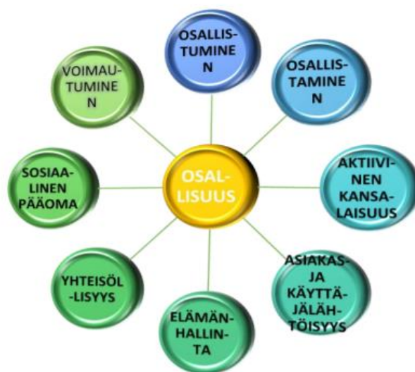
Kuvio 1. Osallisuuden lähikäsitteet (Rouvinen-Wilenius 2013).

Kuntoutuksen vaikutusten ymmärrystä ja selittämistä tukee osallisuuden syy–seuraussuhteisiin pureutuminen osallisuuden toiminnallisuutta sisältävien lähikäsitteiden kautta. Niitä on kuvattu seuraavassa kuviossa 1 (Rouvinen-Wilenius 2013, 117– 125).