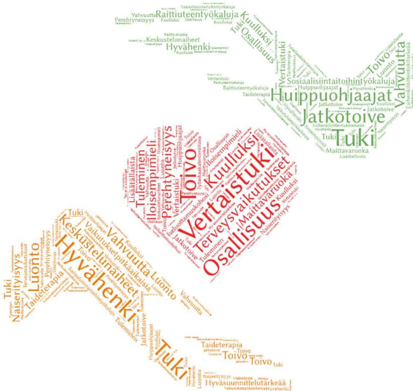
Kuvio 1: Sanapilvi Naiset vahvistumisen äärellä – kuntoutuksen merkityksistä

Seuraavaan sanapilveen (kuvio 1) on koottu tutkimuksessa esiin nousseita toimijoiden ja osallistujien toiminnasta kertovia merkityksiä: