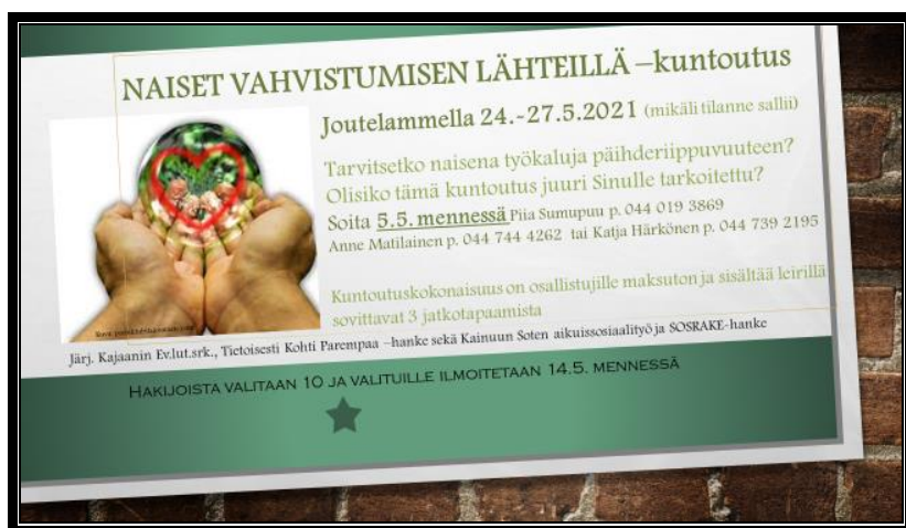
Kuvio 2. Naiset vahvistumisen lähteillä –kuntoutuksen mainos

Kuntoutukseen osallistujat saivat ensikäsityksen kuntoutuksesta mainoksen kautta (kuvio 2). Mainos sisälsi leirin ajankohdan, kuntoutuksen tarkoituksen ja toteuttajien yhteystiedot. Kuntoutuksen kokonaisuuden suunnittelimme yhdessä toimijoiden kesken. Leiriohjelman (liite 1) lähetimme ilmoittautuneille postitse.